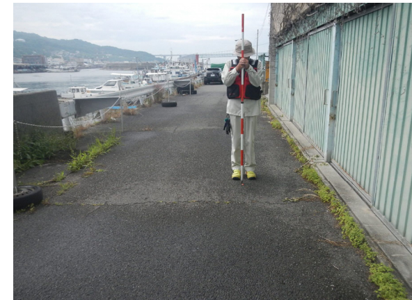
写真2 陸上測量調査のイメージ