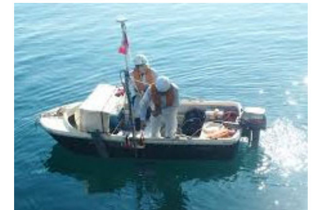
写真3 海上測量調査のイメージ