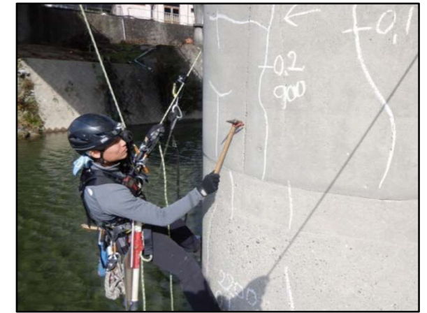
ロープアクセス作業状況